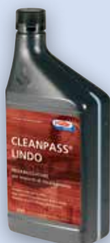
Lindo Super pulizia

Tutti i fluidi CLEANPASS® sono preparati contenenti sostanze classificate NON pericolose ai fini della direttiva 1999/45/CE