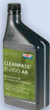
Fluido AR ristabilizzatore