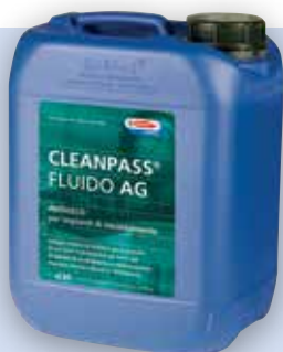
Fluido AG antigelo