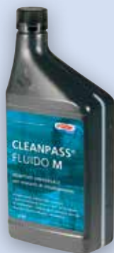
Fluido M Additivo universale